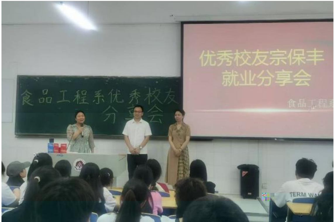
公 产 发 负 2008 工 保 丰 回 供 发 导