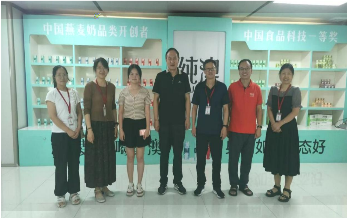
2024 5 , 河 工程 导