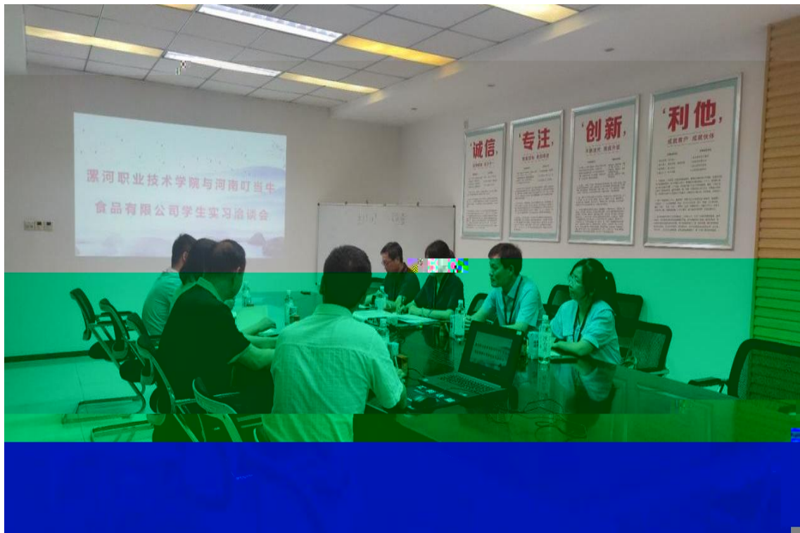
2024 5 , 工